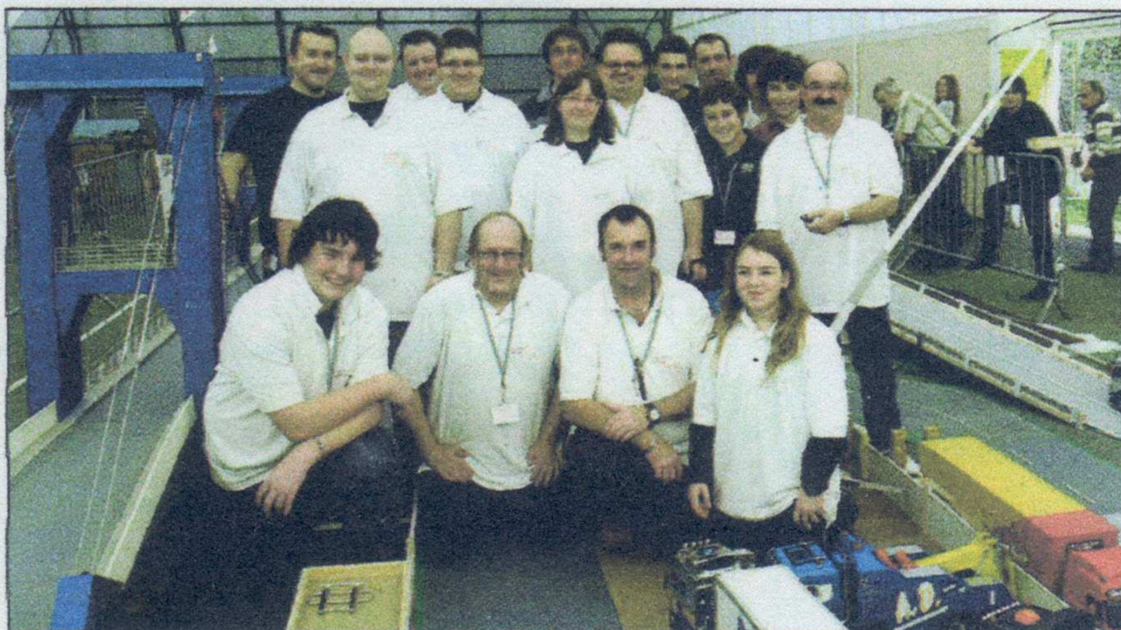
Le club des Mini routiers, des passionnés de modélisme.

Autour de cette piste, le public découvre de nombreuses démonstrations et une piste école, qui s'adresse plus particulièrement aux petits (5-6 ans) ; ils seront proménés sur les mini-camions tandis que les plus grands pourront s'essayer aux télécommandes. Des temps forts seront organisés tout au